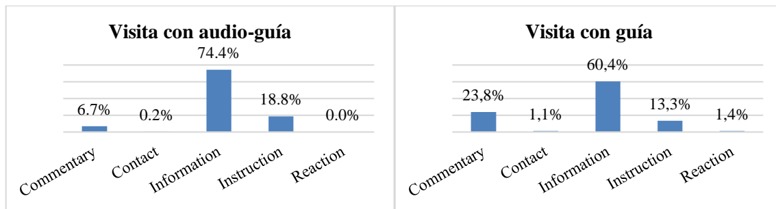
Figura 2. Distribución de los esquemas en las dos modalidades de vistas.

Comparando las características de los textos desde un enfoque general hacia una información detallada, se empieza con la distribución de los esquemas que organizan la estructura textual (figura 2):